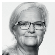
Liselott Blixt Medlem af folketinget